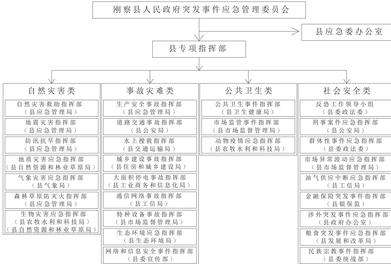
附件 4：刚察县突发事件专项应急救援指挥部及办公室