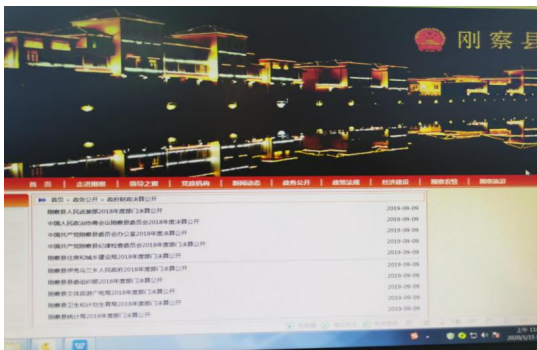
（图为“刚察县司法局”政务公开页面）

我局主动在刚察县政府信息公开网公开 2018 年度部门决算报表，接受群众和社会各界监督。2019 年我局制定文件 117 件，主动公开 15 件。微信“刚察藏汉双语普法平台”累计发布政府信息 124 条，主要反映我局开展普法宣传、人民调解、公证业务、法律援助、归正人员与安置帮教、社区矫正队伍建设等司法行政工作情况、政务动态、政策法规解释等内容。审核备案规范性文件 5 件，对外公开 5 件。行政事业性收费（公证费）12935 元，较去年减少 615 元。